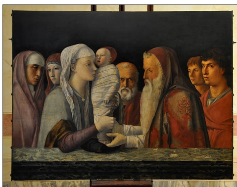
Présentation de Jésus au Temple, de Giovanni BELLINI

« Tout scribe devenu disciple du royaume des cieux est comparable à un maître de maison qui tire de son trésor du neuf et de l'ancien ». Matthieu 13,51.