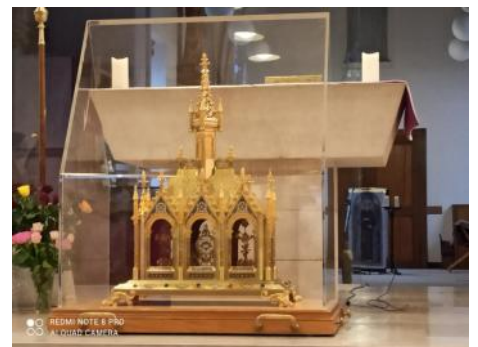
Reliquaire de Ste Thérèse dans la Chapelle du Monastère. Octobre 2021.